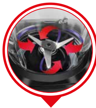
MAGNÍFICA CUCHILLA DE 4 FILOS