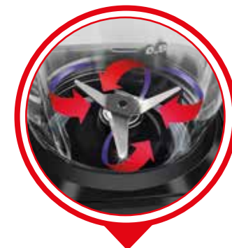
LÂMINA DE AÇO INOX.