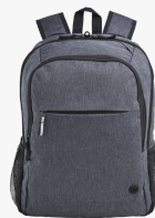
HP Prelude Pro 15.6-inch Backpack 4Z513AA