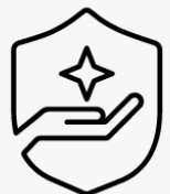
3 años de recogida y devolución U4819E