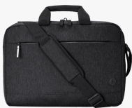
Maletín HP Prelude Pro para portátil de 17,3 pulgadas 3E2P1AA