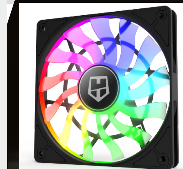
HALO ILUMINACIÓN LED ARGB ILUMINACIÓN ARGB Y DISEÑO INNOVADOR