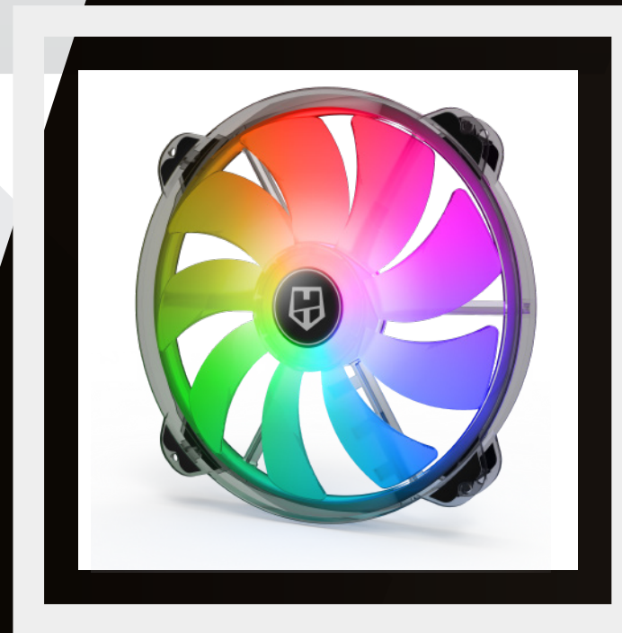
HALO ILUMINACIÓN LED ARGB ILUMINACIÓN ARGB Y DISEÑO INNOVADOR